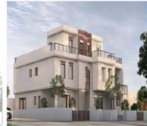
3D exterior shot