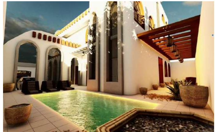
Design & Implementation of Some Buildings in Saudi Arabia